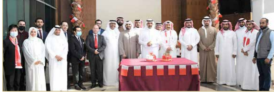
جانب من الاحتفال

حمد آل خليفة ترسم مملكة البحرين قصص نجاح كبيرة وتثال احترام وتقدير وإشادة العالم أجمع. وبين سعادة محمد بن خليفة آل خليفة مناسبة الأعياد الوطنية فرصة لفرس قسم الوطنية والانتماء في نفوس الشباب في ظل ما تحمله هذه الذكرى من قيم سامية، مؤكدا حرص الوزارة على المشاركة في هذا العرس الوطني، مشيدا بما تقدمه جميع منتسبي الوزارة من عطاءات مقدرة ومشكورة في سبيل تحقيق التطلعات الوطنية والأرتقاء بقطاع الطاقة ليقيم بدوره في خدمة ودعم الاقتصاد الوطني.