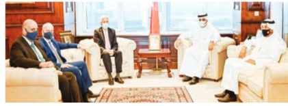
وزير المالية خلال لقاء المدير التنفيذي للبنك الدولي.

أكد الشيخ سلمان بن خليفة وزير المالية والاقتصاد الوطني أن مملكة البحرين تسير في الاتجاه الصحيح نحو تحقيق التعافي الاقتصادي المنشود، وذلك بفضل الجهود الحثيثة والمندورة التي شكلت منطلقات أولويات وبرامج خطة التعافي الاقتصادي، مشيراً إلى أن جهود الحكومة خلال فترة الجائحة التي تركزت في حماية المجتمع من الآثار الصحية عبر إجراءات صحية للتصدي للجائحة، وحماية المجتمع من الآثار الاقتصادية بإطلاق الحزمة المالية والاقتصادية بعلية وصل إلى 4.9 مليارات دينار بحريني وذلك لإنقاذ القطاعات الأكثر تضرراً والحفاظ على وظائف المواطنين، وضع البحرين بالموقع الأنسب للاستفادة من التعافي الاقتصادي ودعم الجهود القائمة عبر برنامج التوازن المالي الذي انطلق قبل الجائحة للتأمين بخلق ثابته نحو تعزيز الاستقرار المالي. وقال إن المساعي الكبيرة التي تمت اليوم من أجل تحقيق التعافي الاقتصادي بروج الفريق الواحد من قبل أعضاء فريق البحرين في مساعٍ مشتركة وتصب في تحقيق الأهداف التنموية المنشودة للمملكة والوصول إلى الاستقرار المالي الذي يعد مركزاً رئيسياً