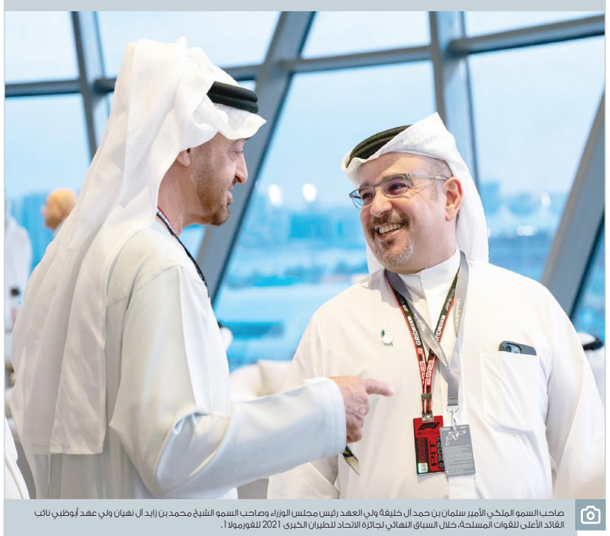
صاحب السمو الملكي الأمير سلمان بن حمد آل خليفة ولي العهد رئيس مجلس الوزراء وصاحب السمو الشيخ محمد بن زايد آل نهيان ولي عهد أبوظبي نائب القائد الأعلى للقوات المسلحة، خلال السباق النهائي لجائزة الاتحاد للطيران الكبرى 2021 للعلوم 1.

أخيراً أجهل ما في الموضوع أن العقيلة التي خططت لهذا المشروع وأشرفت على تنفيذ من الجانب الحكومي والعقيلة التي استفادت من هذا المشروع من جانب القطاع الخاص وساهمت بتقديم نوعية ممتازة من الخدمات تضاهي ما هو موجود في السوق العقاري الخاص كلما عقول بحرينية شابة من عائلنا ومن ألفها إلى يانها بحرينية منا وفيها الأ يستحقون الثناء والتقدير والاحتراف وتوثيق نجاحاتهم؟